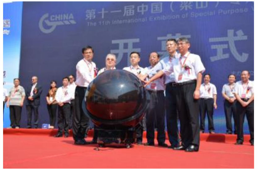
与会领导及嘉宾为第十一届中国（梁山）专用汽车展览会开幕按启动球