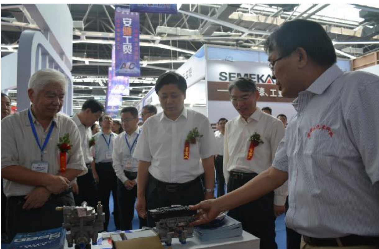
第十三届中国（梁山）专用汽车展览会上与会领导到场指导