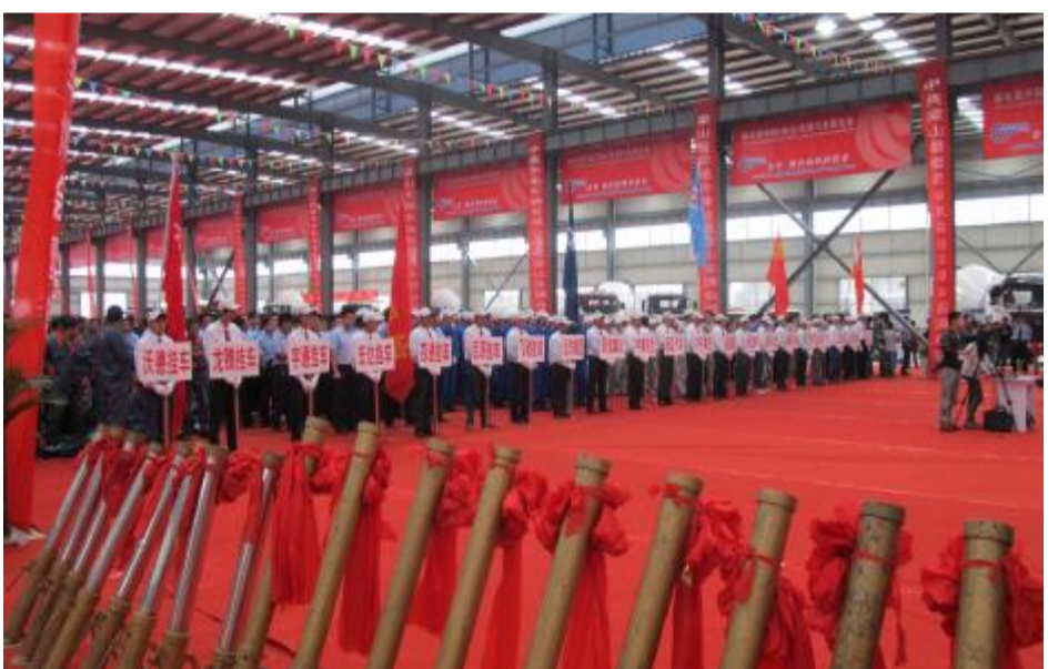
第七届中国（梁山）专用汽车展览会开幕仪式现场