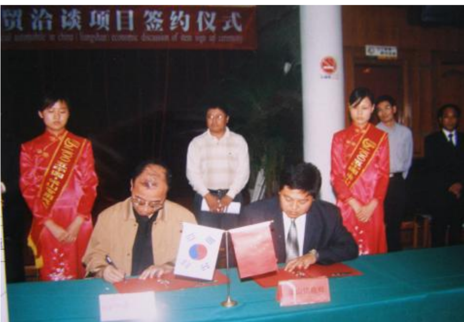
首届汽车展销会签约仪式现场