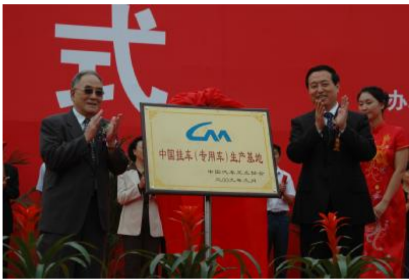
第五届中国（梁山）专用汽车展览会中国挂车（专用车）生产基地揭牌仪式现场