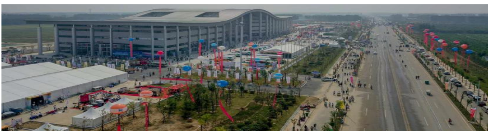
第十三届中国（梁山）专用汽车展览会展厅航拍图