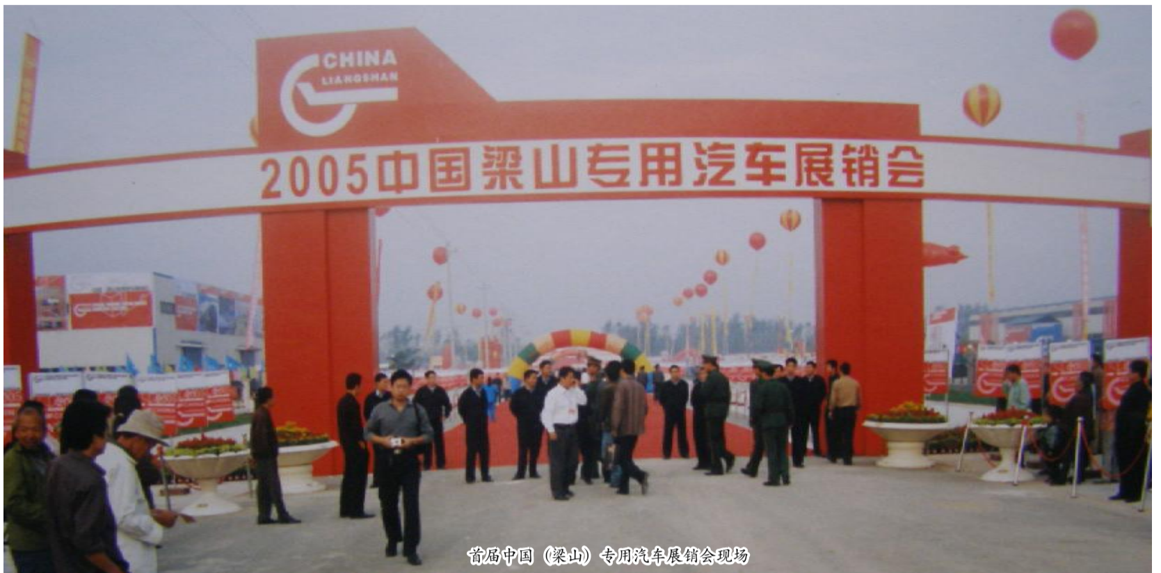
首届中国（梁山）专用汽车展销会现场

沧海桑田，时光如梭，梁山旧貌换新颜，梁山的专用汽车产业实现高质量发展。本报现搜集了往届车展会的珍贵资料，邀您一起用心去感受时代的脉动，用镜头记录一个产业崛起的波澜壮阔！回顾过去，展望未来，让我们不忘初心，砥砺前行，努力为我县专用汽车发展再谱新篇，再创辉煌！