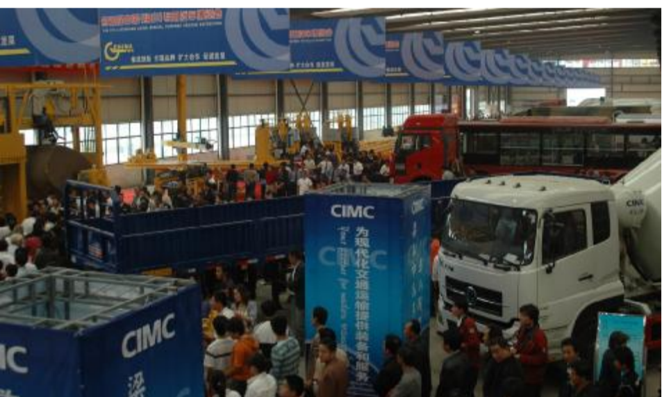
第五届中国（梁山）专用汽车展览会展厅人山人海